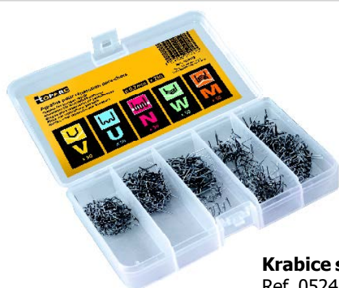
Krabice s 250 sponkami Ref. 052413