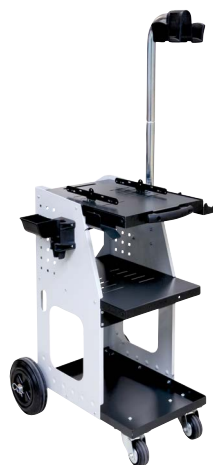
ref. 051331 + 052284 UNIVERSAL 800 + Vozík s držákem