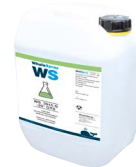
ref. 062511 speciální svařování chladicí kapaliny - 5 l