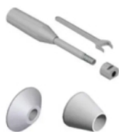
VPD18 Sada malých adaptérů pro kotouče a buben, upínací trn - Ø18 mm