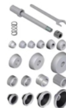
TDL30 Sada adaptérů pro centrování lehkých disků a bubnů