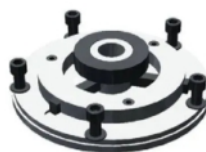
AC1188 Univerzální adaptér pro beznábojový brzdový buben D1: 271-300 mm, D2: 335 mm, N: 10