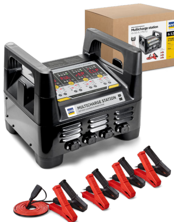
Odpojitelné kabely 1,5 m