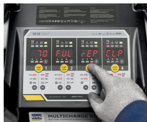
Digitální displej pro každý výstup