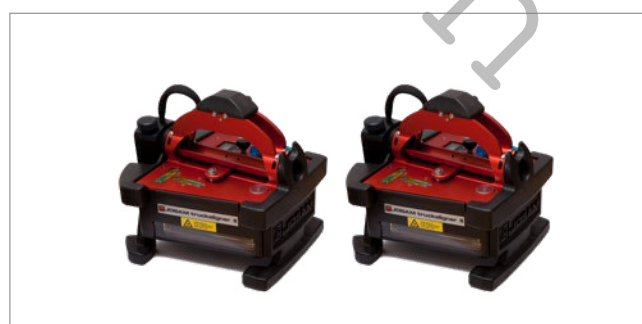
Truckaligner II s Bluetooth spojením s PC