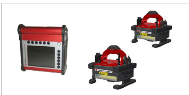
Truckaligner II s rádiovým spojením s ruční jednotkou