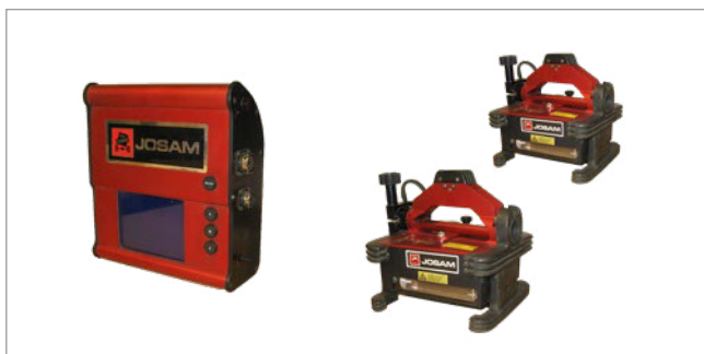
Truckaligner I s kabelovým spojením s ruční jednotkou

Následující systémy Truckaligner opravňující k využití slevy: