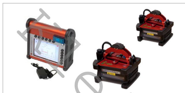
Truckaligner II s Bluetooth spojením s ruční jednotkou